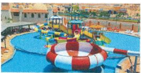
16417 Marsilia Aqua Park - Marsa Matruh

وتشمل وجبة غداء مكونة من (( نص فرخة مشوية + ارز خلطة + سلطة + خبز + مشروب ))